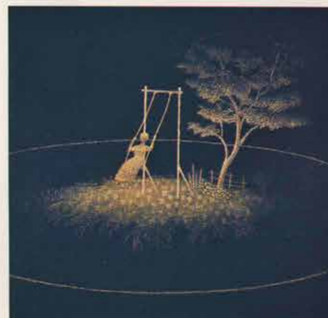
(Nog geen titel) 170 x 65 cm Detail gemengde techniek op linnen.

In die wetenschap gaat Vredegoor de trap op, naar zijn atelier, om het mysterie in verf gestalte te geven. Vraag: waarom overheerst het zwart in je recente werk? Antwoord: "De kleur komt wel terug, nu heb ik het duister nodig. Om in te turen en te zien wat er opdoemt." ●